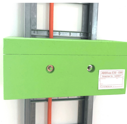
WSP als Steigleiter